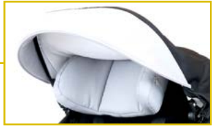
Visera con ventanilla