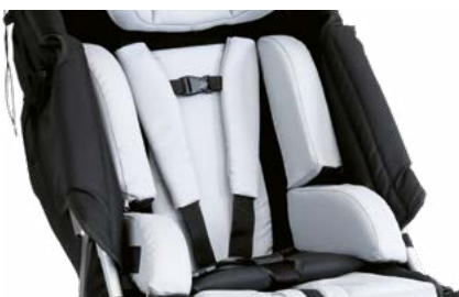
Apoyos laterales para tronco