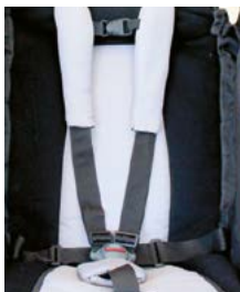
Cinturón de 5 puntos