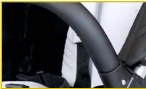
Cinturón de seguridad