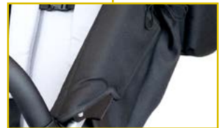
Respaldo y asiento ajustables y reclinables