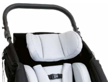
Apoyos laterales para cabeza