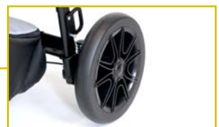
Ruedas traseras con amortiguación