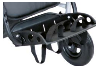
Reposapiés con cinchas