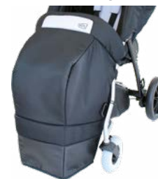
Saco de dormir