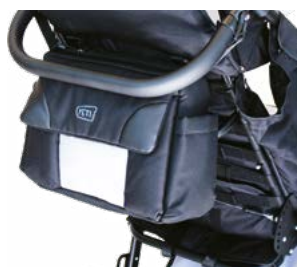
Bolsa para manillar