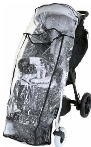
Protector para lluvia