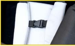
Controles de cabeza, tronco y pelvis