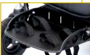
Reposapiés plegable y ajustable en altura