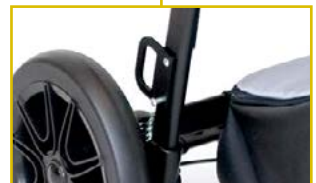
Kit de transporte